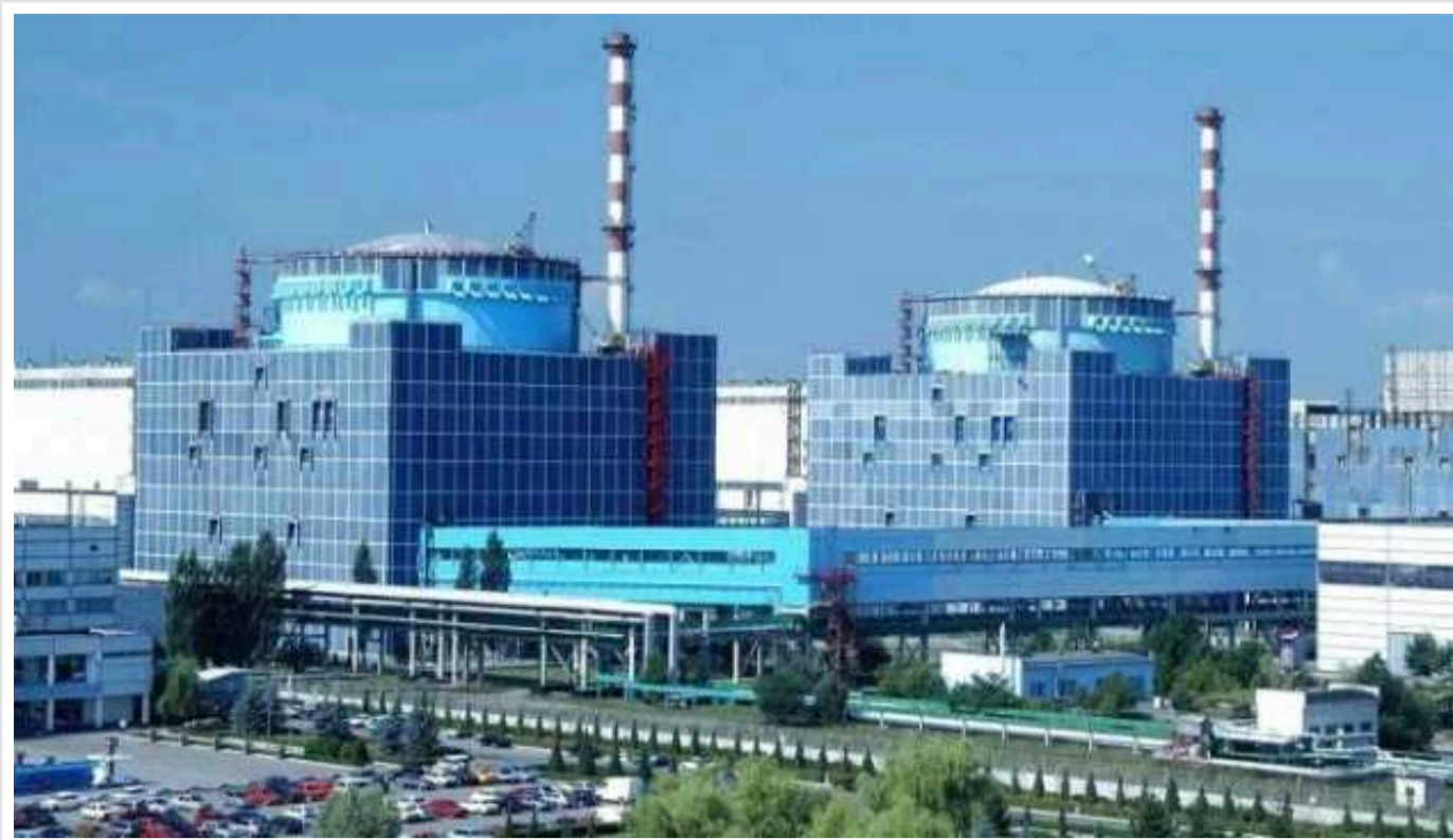
Уряд попереджає про ризик ядерного інциденту в разі, якщо РФ почне обстрілювати об'єкти атомних електростанцій

В українському уряді продовжують попереджати про ризик ядерного інциденту у випадку, якщо Росія почне обстрілювати об'єкти атомних електростанцій.