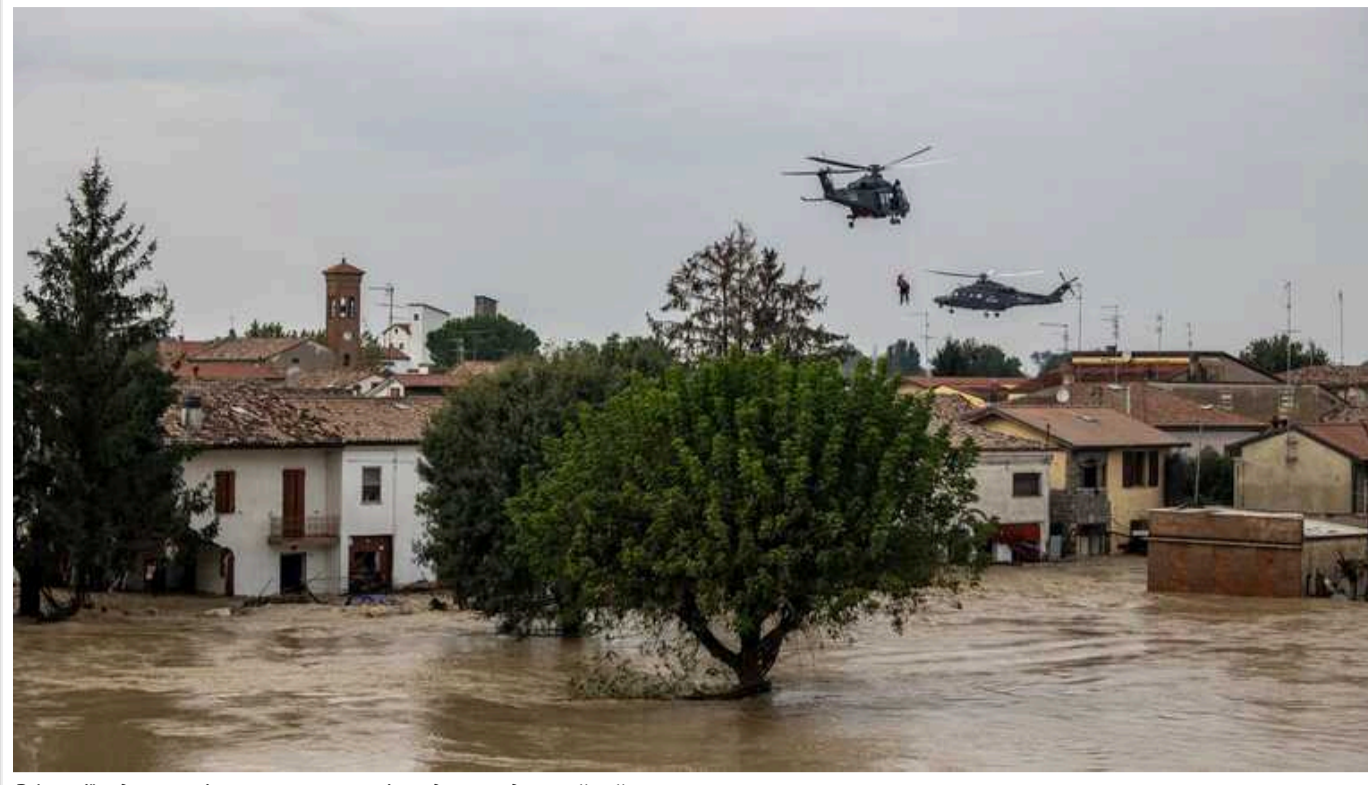
В Італії у двох регіонах через повені введено надзвичайний стан

Уряд Італії в суботу, 21 вересня, оголосив надзвичайний стан в Емілії-Романьї та Марке у відповідь на руйнівні повені, що сталися цього тижня в цих регіонах, і ухвалив початкове виділення 20 мільйонів євро на допомогу.