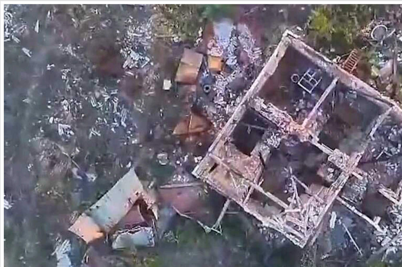
Прикордонники на Бахмутському напрямку атакували позиції росіян та ліквідували ворожу піхоту

Оператори бомбардувальників підрозділу РУБпАК "Фенікс" бригади "Помсти" на Бахмутському напрямку "задали удару" по позиціях окупантів.