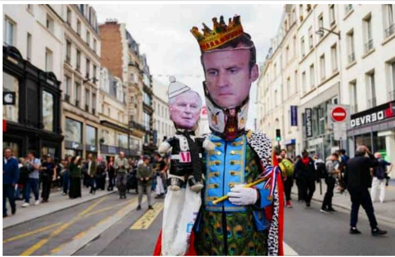
У Франції відбуваються численні демонстрації проти Макрона та нового прем'єр-міністра

У Франції в суботу, 21 вересня, відбулося близько п'ятдесяти акцій протесту проти "заперечення демократії" у зв'язку з призначенням президентом Еммануелем Макроном прем'єр-міністра Мішеля Барньє.