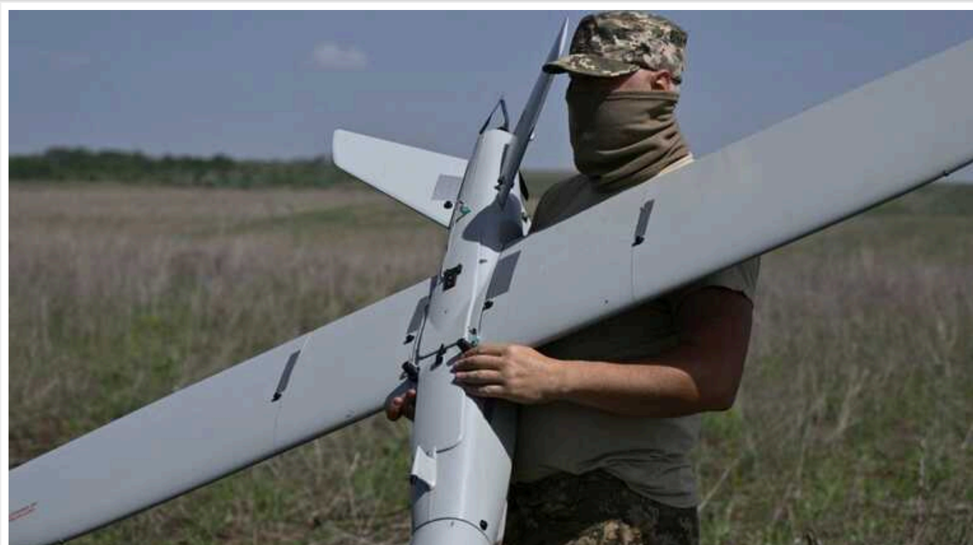
Дрони СБУ вдарили вночі по аеродрому в Калузькій області РФ

Цієї ночі дрони СБУ "завітали" на склад боєприпасів у Тверській області та військовий аеродром Шайковка в Калузькій області.