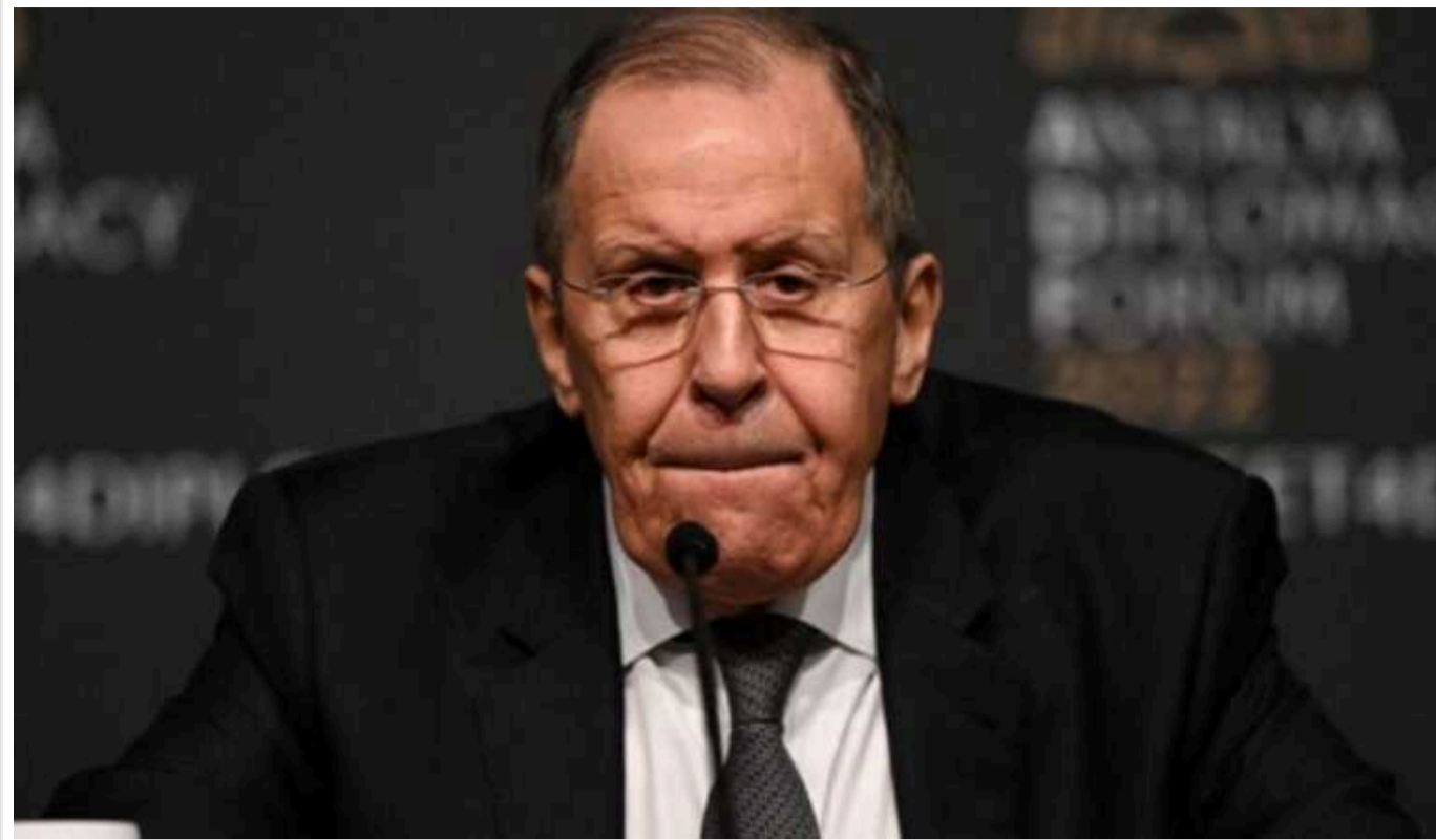
Лавров заявив, що Путін пожартував про підтримку Камали Гарріс

Російський міністр закордонних справ Сергій Лавров зазначив, що Володимир Путін "пожартував", коли нібито висловлював підтримку кандидатурі Камали Гарріс на виборах президента США.