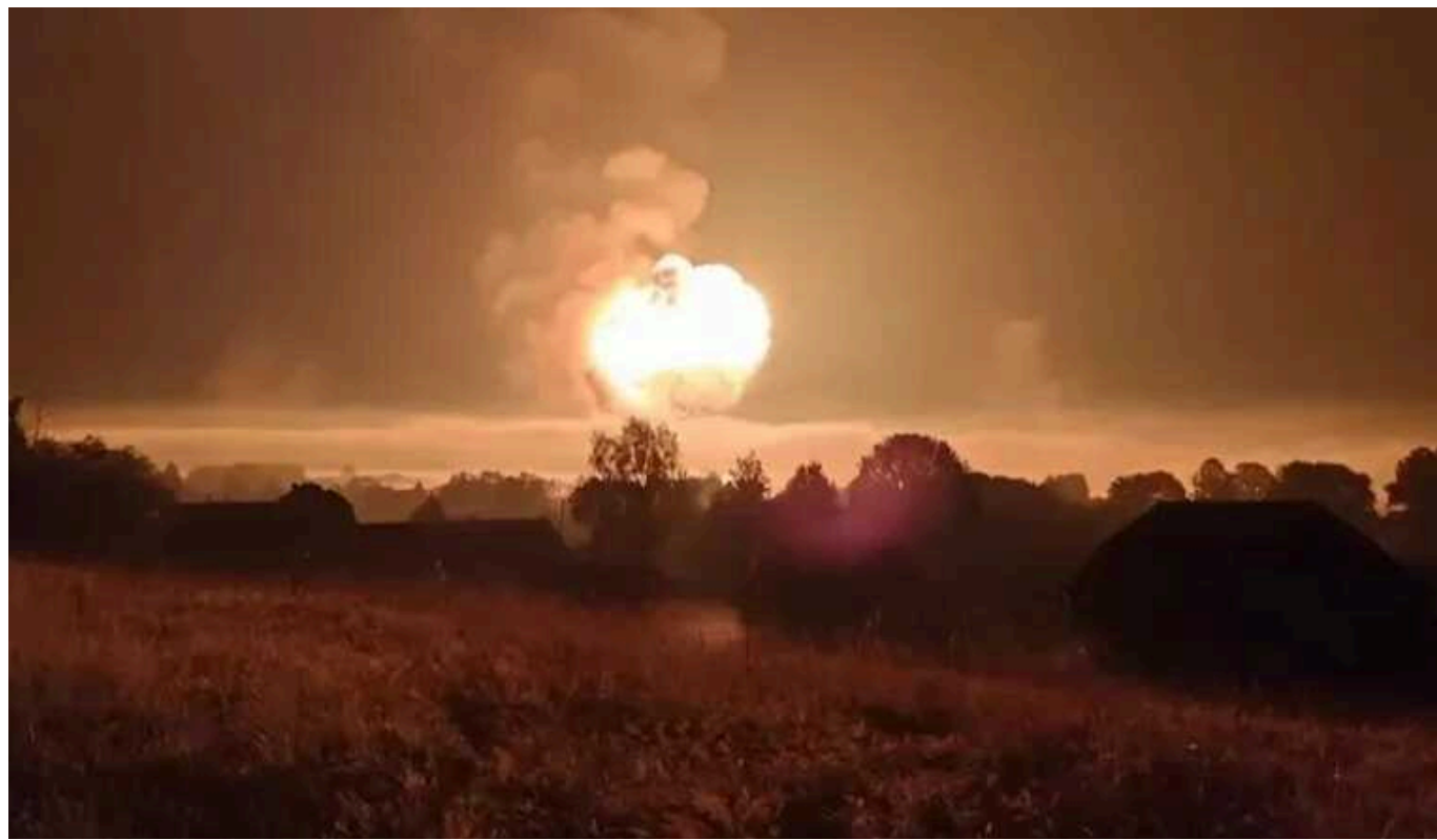
У Генштабі підтвердили атаку на два склади боєприпасів у РФ

Сили оборони України вразили два військові арсенали збройних сил Росії на її території. Крім того, під удар українських військових потрапила також російська радіолокаційна станція.