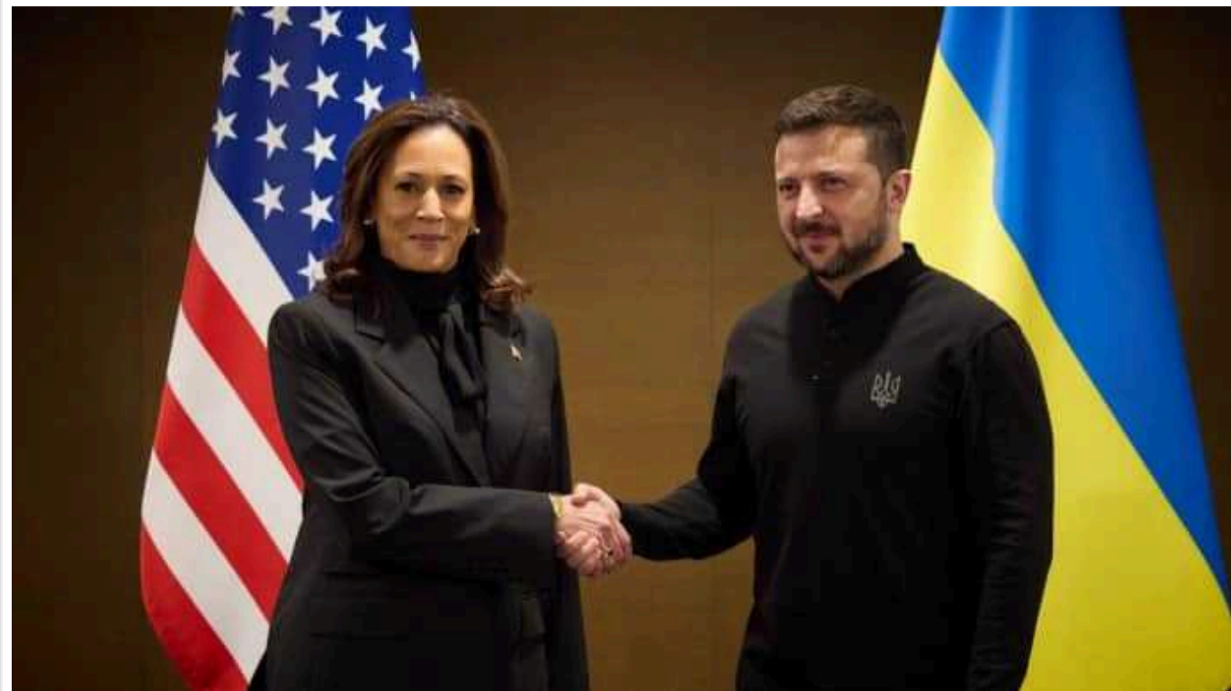
Соратник Гарріс у Конгресі стверджує, що вона в разі перемоги підтримуватиме Україну

Член Палати представників США від Демократичної партії Джиммі Панетта, який вважається близьким до Камали Гарріс, вважає, що в разі її перемоги на президентських виборах вона продовжить підтримувати Україну у війні проти Росії.