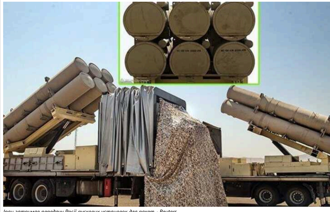
Іран затримав передачу Росії пускових установок для ракет, - Reuters

Іран не надав Росії необхідні мобільні пускові установки для балістичних ракет ближнього радіуса дії Fath-360.