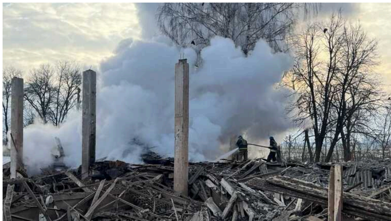
У цьому році значно зросла кількість обстрілів Сумщини, - ОВА

Кількість обстрілів, що здійснює Росія по Сумській області, в порівнянні з показниками минулого року істотно зросла.