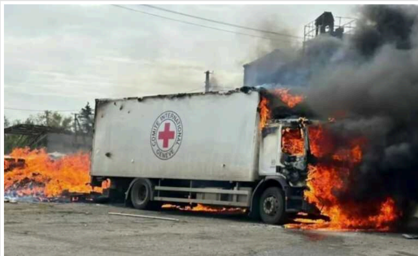
Україна збрала докази атаки РФ на гуманітарну місію Червоного Хреста в Донеччині

Офіс генпрокурора зібрав докази, що 12 вересня російська армія вчинила черговий військовий злочин на Донеччині, завдавши удару по трьох автомобілях Міжнародного Комітету Червоного Хреста у селі Віролюбівка під час роздачі гуманітарної допомоги.