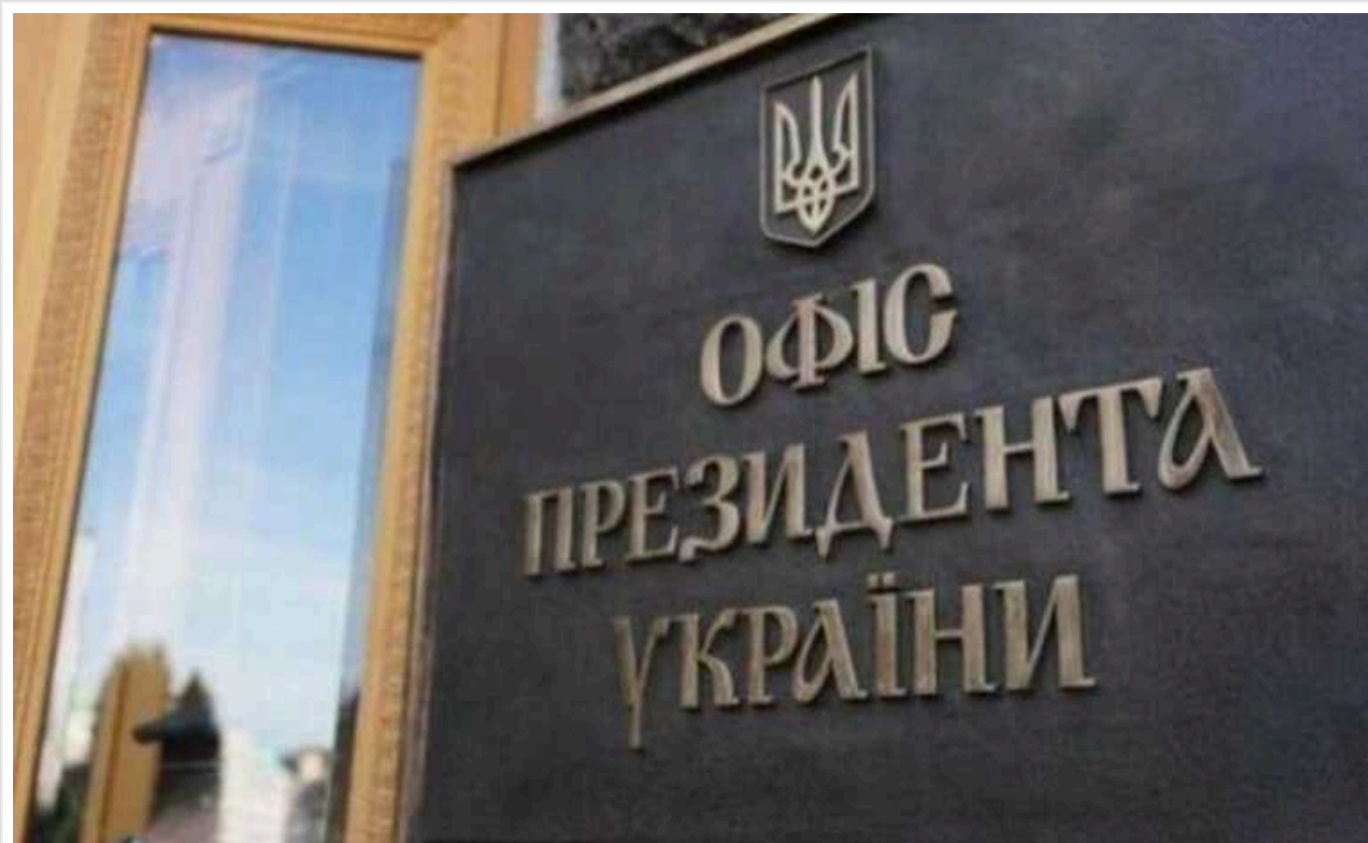
Офіс президента спростував інформацію ЗМІ про те, що Україна провела зустрічі з представниками РФ в онлайн-форматі

У пресслужбі президента України спростували інформацію про те, що Зеленський стверджував, начебто Україна вже провела онлайн-зустрічі з представниками Росії.