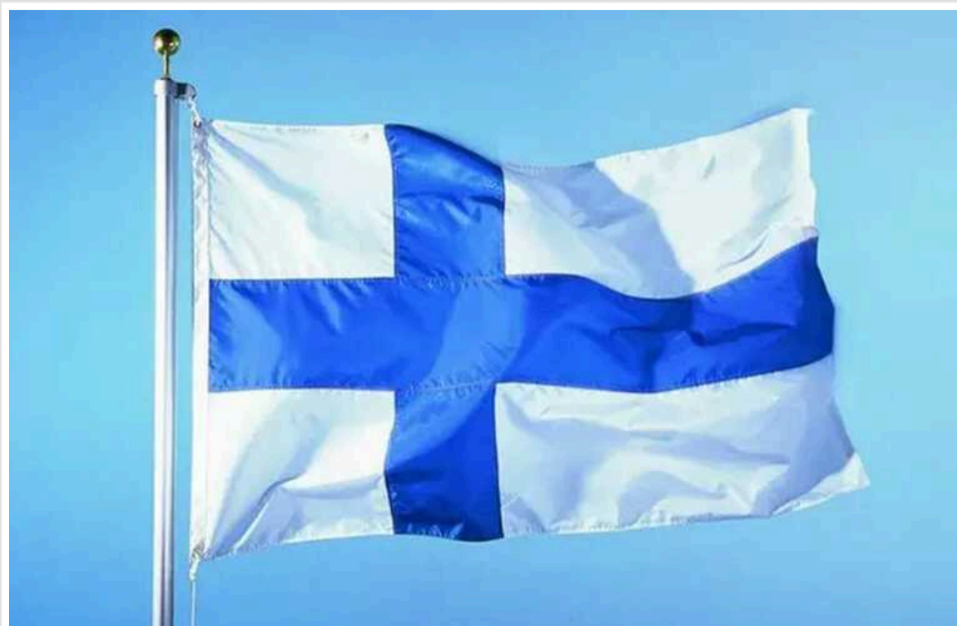
Під час наступного обміну, Росія може шантажувати країну заручниками, - поліція безпеки Фінляндії

Великий обмін ув'язненими між Заходом і Росією на початку серпня може створити прецедент, що спонукатиме Росію й далі використовувати заручників як засіб шантажу.