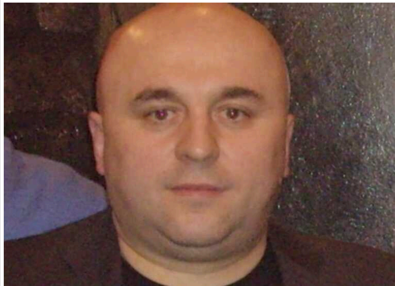
Внаслідок ракетного обстрілу загинув полковник ЗСУ Олександр Никитюк

20 вересня на Донеччині загинув полковник Збройних сил України Олександр Никитюк.