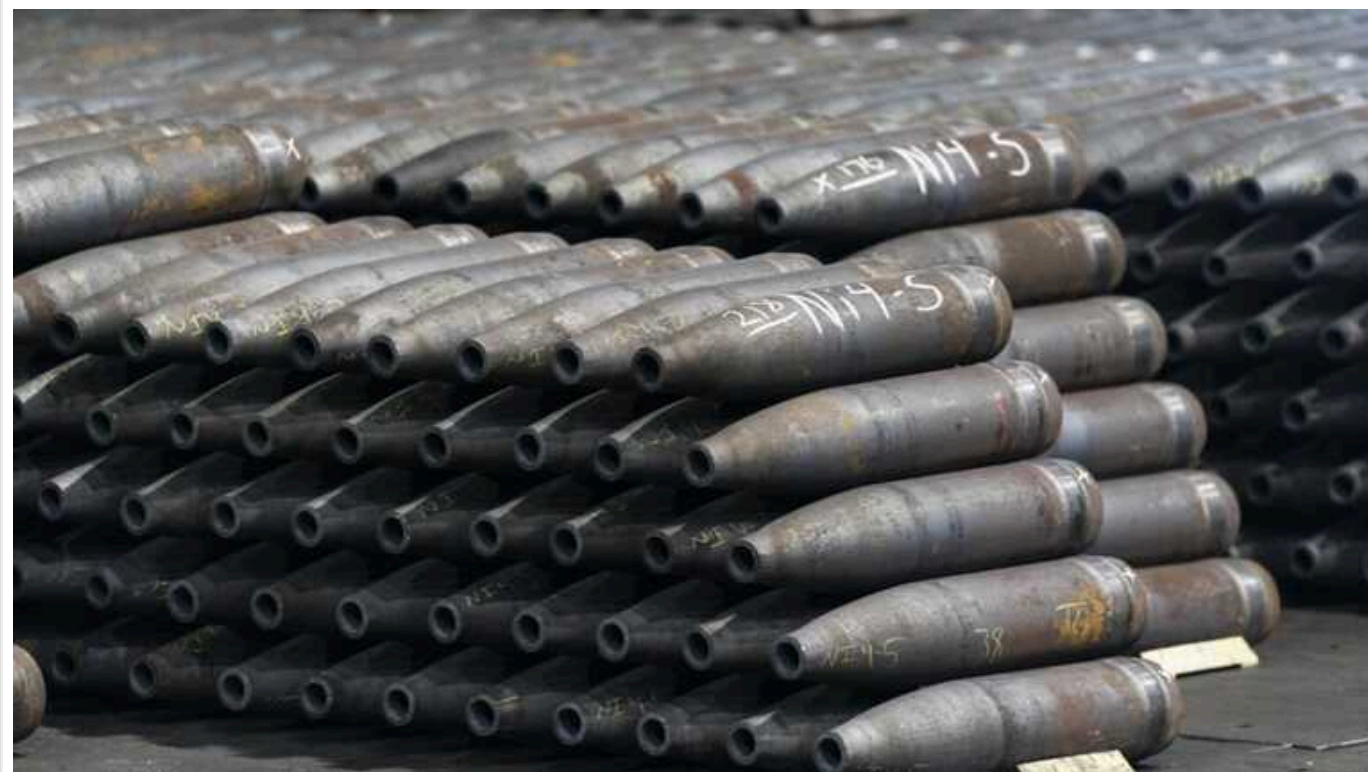
Defense Express: У Краснодарському краї знищено базу, куди ввозили снаряди з КНДР

Під Тихорецьком Краснодарського краю РФ було атаковано 719 базу артилерійських боєприпасів, куди росіяни доставляли північнокорейські снаряди.