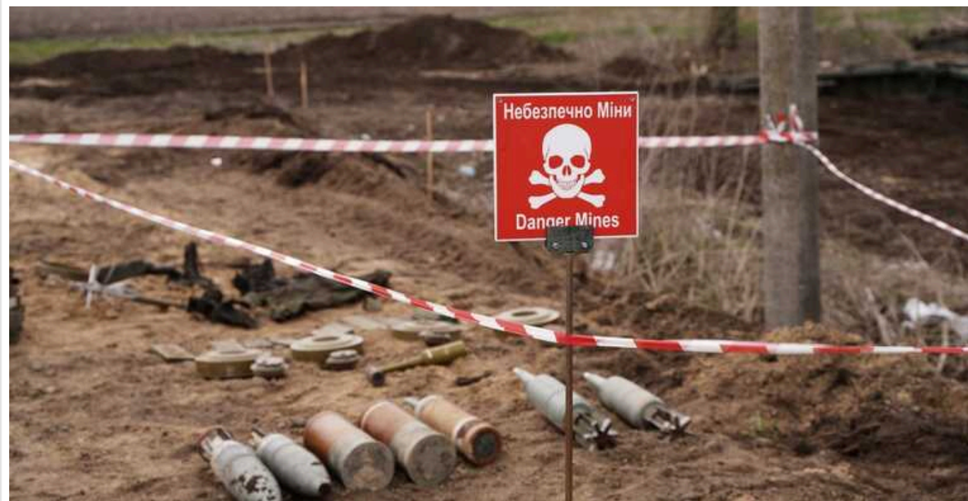
ООН: На повне розмінування України традиційними методами може знадобитися 100 років

В Організації Об'єднаних Націй підрахували, що для повного очищення території України від мін та інших вибухонебезпечних предметів може знадобитися щонайменше сто років. Це за умови розмінування української землі традиційними методами.