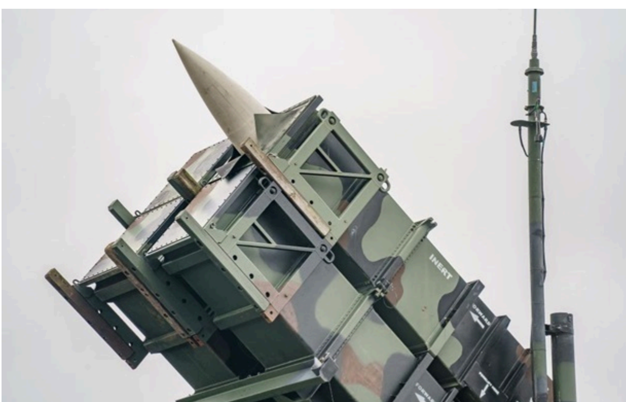
Україні критично бракує ракет РАС-3

Нинішні темпи поставок ППО у рамках програми PURL вже не відповідають реальному масштабу загрози, вказано у листі, який потрапив у розпорядження ЗМІ.