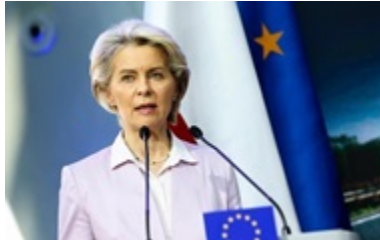
Глава ЄК анонсувала посилення української ППО 24 травня 2026, 14:55