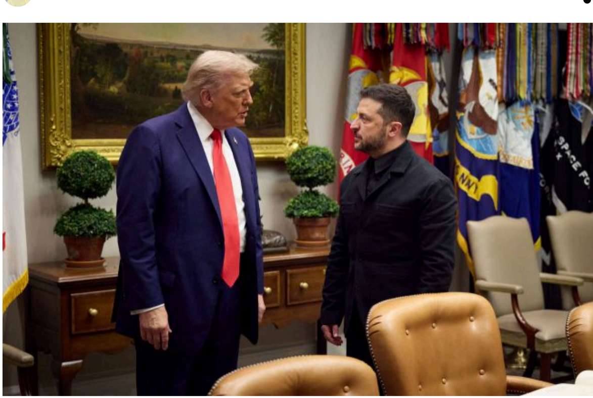
Фото: Володимир Зеленський і Дональд Трамп

Не витрачай час на шум! Читай тільки суть з РБК-Україна у Google