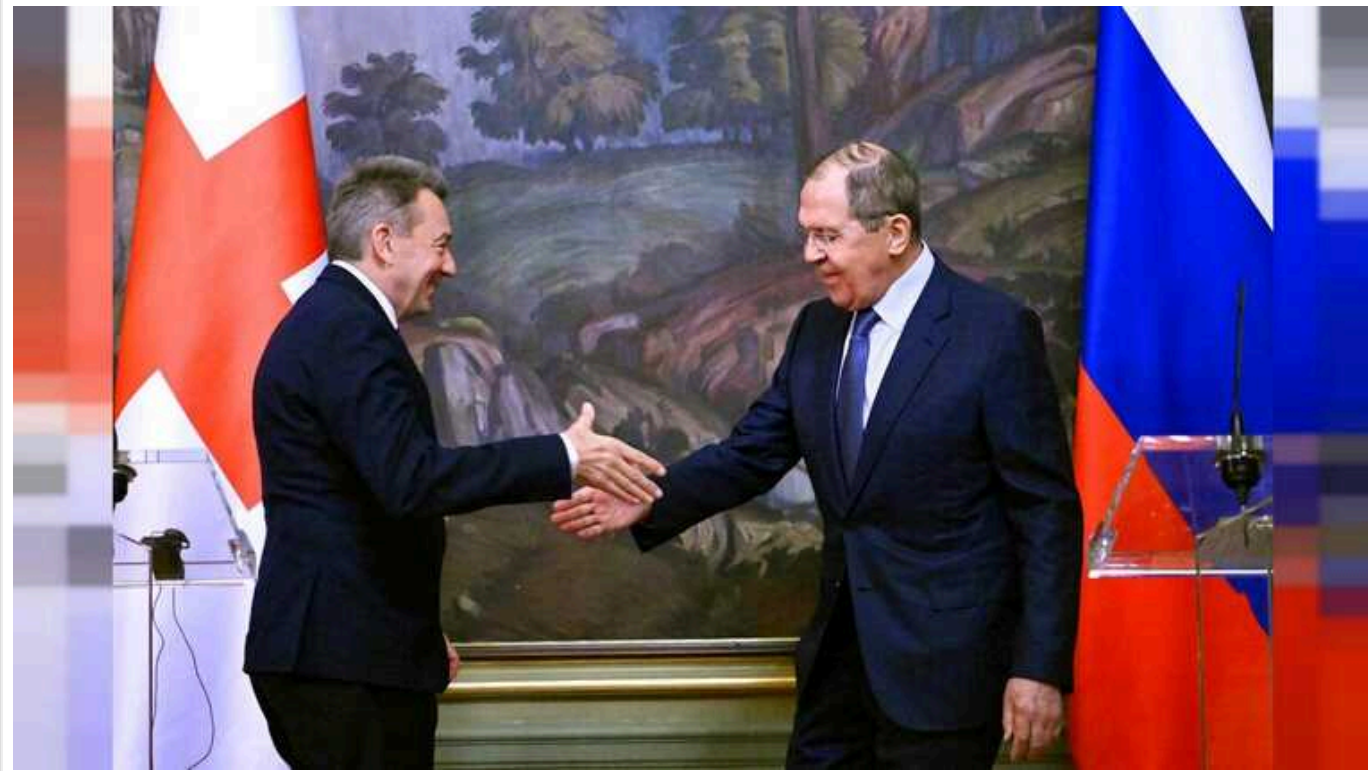
ISW: Росія намагається узаконити окупацію України через Міжнародний комітет Червоного Хреста

Російські посадовці через співпрацю з Міжнародним комітетом Червоного Хреста намагаються легітимізувати окупацію України та просувати наративи про нібито порушення прав людини в нашій країні. МКЧХ функціонує як інструмент пропаганди Кремля на окупованих територіях України.