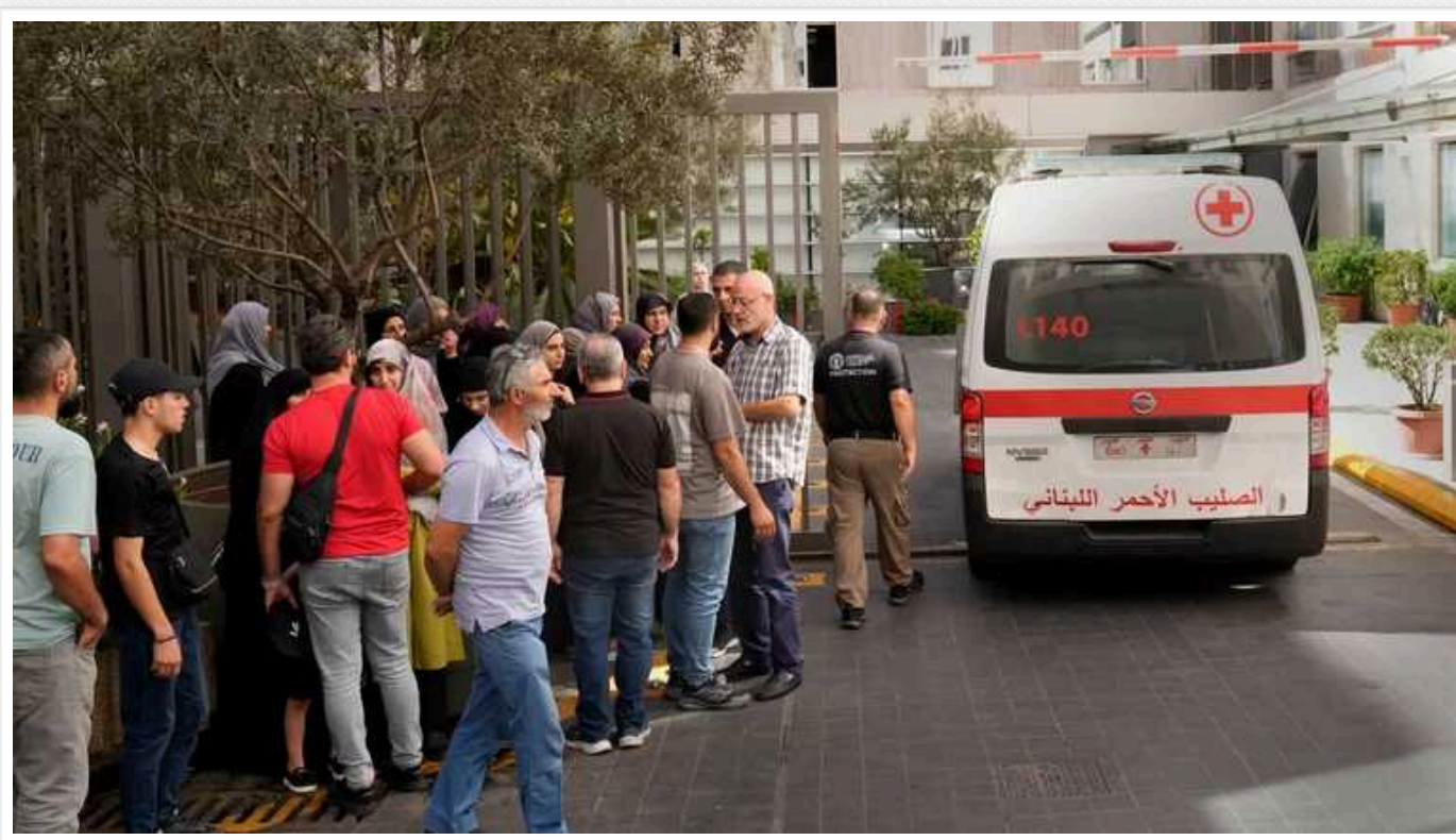
В ООН прокоментували вибух пейджерів у Лівані

Фолькер Тюрк, Верховний комісар ООН із прав людини, вважає, що атака з використанням пейджерів та іншої техніки в Лівані є порушенням гуманітарного права. Він висловив свою стурбованість нападами на мирних жителів у Лівані 17 і 18 вересня.