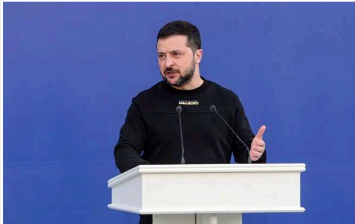
Bloomberg: У США Зеленський наполягатиме на запрошенні в НАТО й постійних постачаннях зброї

Президент Володимир Зеленський наполягатиме на тому, щоб президент США Джо Байден офіційно запросив Україну в НАТО й взяв на себе зобов'язання щодо постійних постачань сучасної зброї в рамках українського плану перемоги.