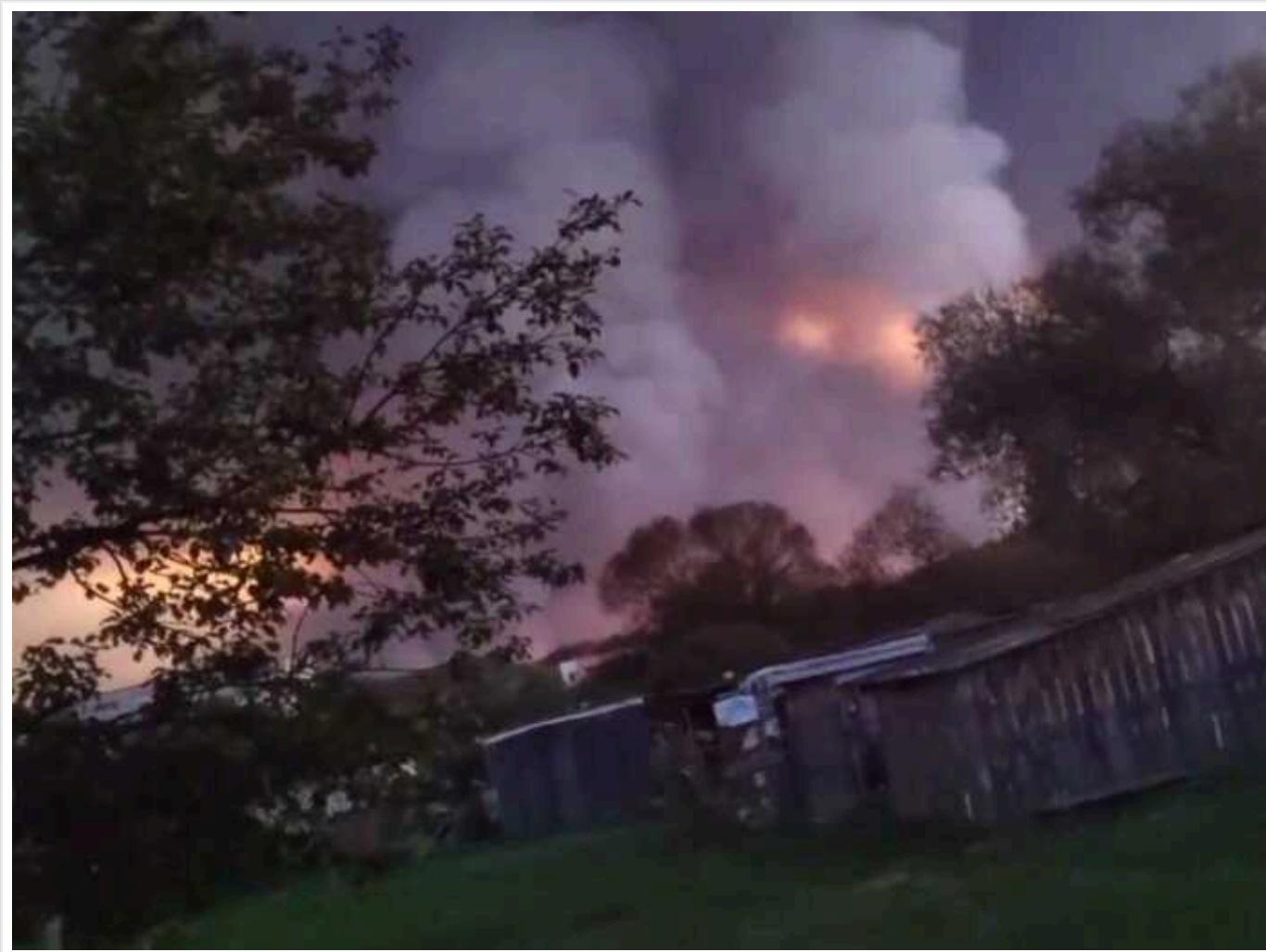
БПЛА атакували ще один склад боєприпасів у Тверській області РФ: лунають вибухи

У районі селища Октабрьське Тверської області безпілотники здійснили атаку на 23-й арсенал Головного ракетно-артилерійського управління Міноборони РФ. Місцеві мешканці повідомляють про сильні вибухи.