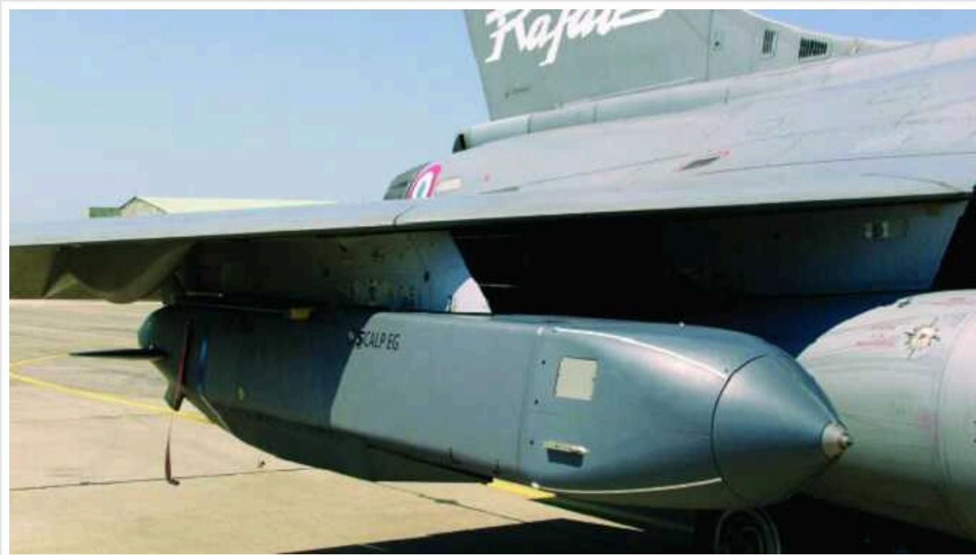
The Times: Україні таємно дозволять бити по РФ ракетами Storm Shadow

США та Британія не будуть офіційно заявляти про дозвіл на застосування далекобійних ракет до їх першого запуску.