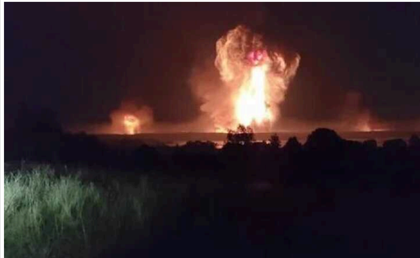
У розвідці Естонії прокоментували удар по Торопцю: наслідки на фронті помітимо найближчими тижнями

Атака українських безпілотників на склад із ракетами в російському місті Торопець матиме наслідки для фронту. Вони стануть помітні протягом найближчих тижнів.