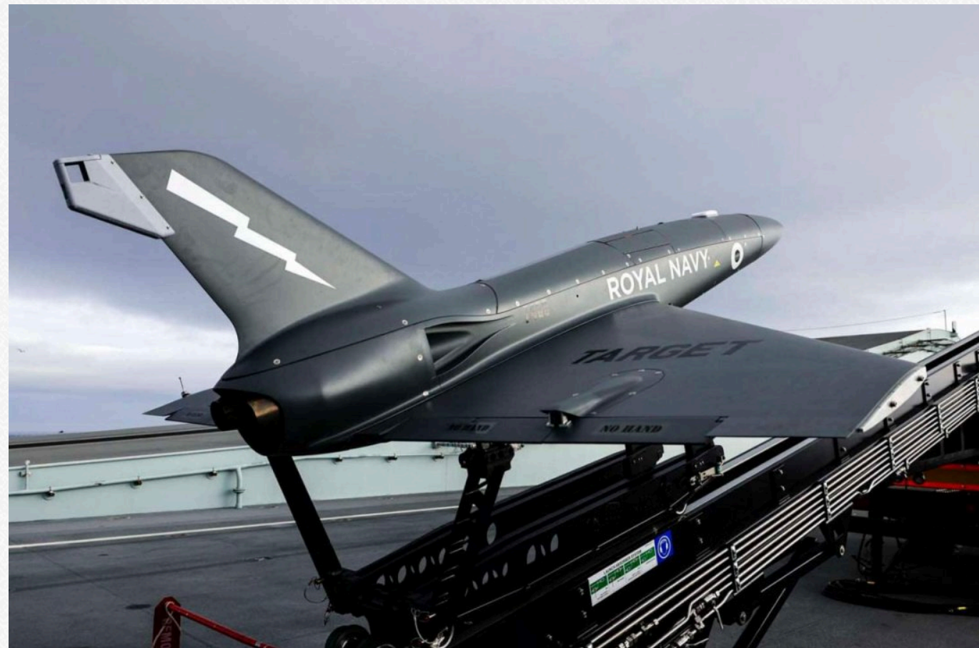
Фото дрона QinetiQ Banshee Jet 80

Крім того, аналітики нагадали, що "Паляниця" — не єдиний реактивний дрон в арсеналі ЗСУ. Україна вже неодноразово використовувала такі БПЛА, зокрема QinetiQ Banshee Jet 80.