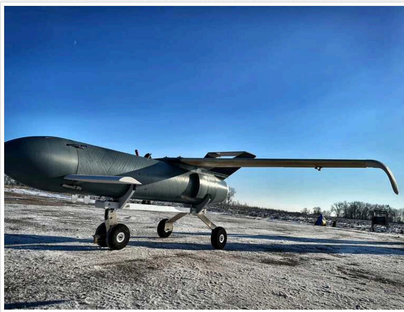
В РФ похвалилися, що нібито збили дрон "Паляниця": в Defense Express розповіли деталі

ЗС РФ "знешкодили" в Курській області невідомий безпілотник з реактивним двигуном. Проте аналітики пояснили, що "Паляниця" не є єдиною розробкою Сил оборони.