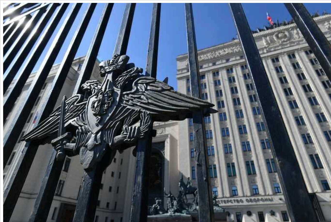
У РФ 14 громадян Гани обманом змусили підписати контракт із Міноборони та відправили в Донецьк

14 громадян Гани обманним шляхом вивезли до Росії, пообіцявши високу зарплату, і змусили підписати контракт з Міноборони, після чого відправили на фронт.