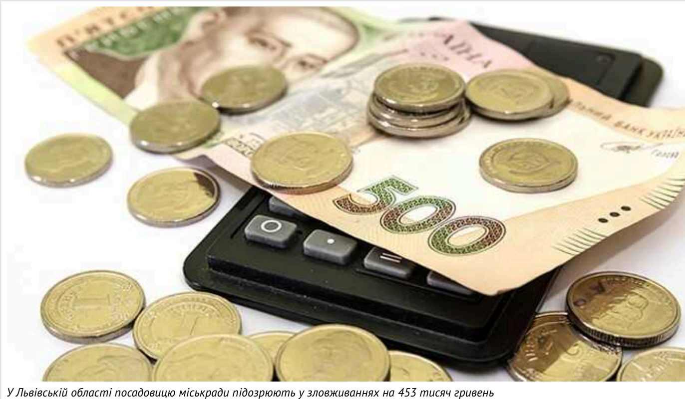
У Львівській області посадовицю міськради підозрюють у зловживаннях на 453 тисяч гривень

Відділ освіти Великокомістівської міської ради міг виплатити підряднику за роботи, які не були виконані у дитячому садку.