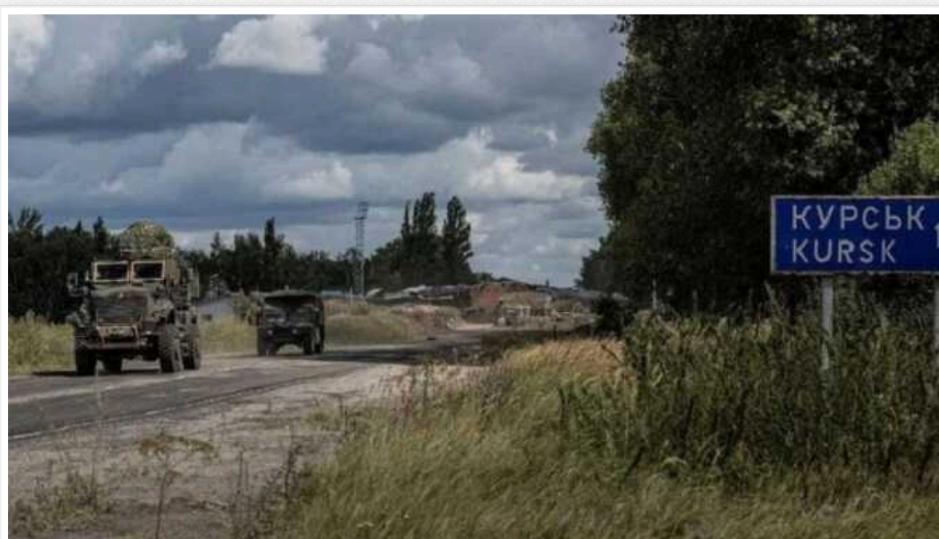
Жителі села на Курщині поскаржились Путіну на мародерство: "ЗСУ не було, але все розграбовано"

Мешканці селища Коренево, контроль над яким в даний час мають російські військові, надіслали звернення до диктатора Володимира Путіна з вимогою захистити їх від мародерів та покарати винних. Проте грабують місцевих мешканців не українські захисники, а саме російські окупанти, підкреслено у зверненні.