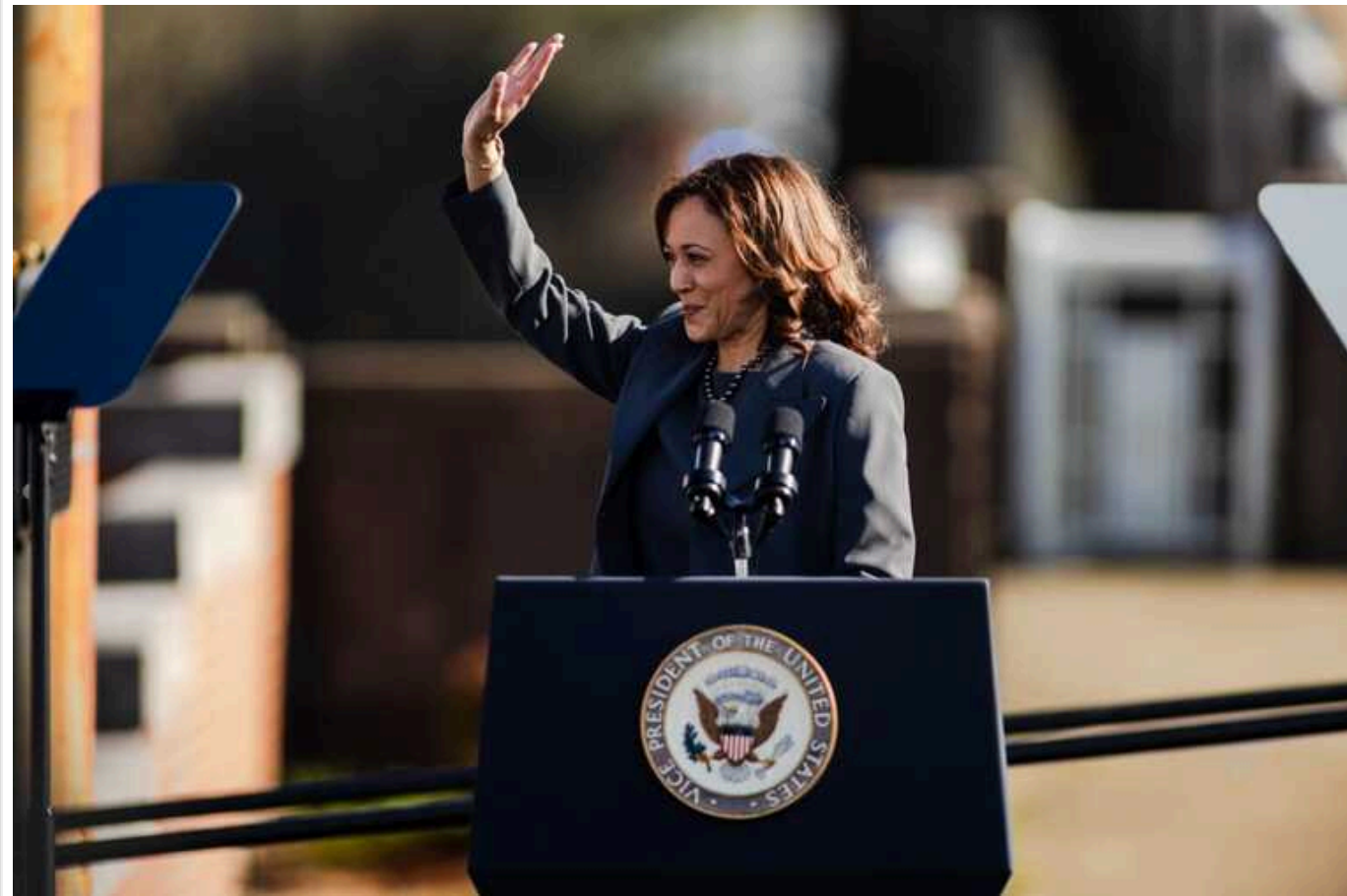
Професор, який передбачив перемогу Байдена, спрогнозував, хто виграє вибори в США

Відомий своїми точними прогнозами президентських виборів у США історик і професор Алан Ліхтман, якого часто називають "Нострадамусом американських виборів", передбачив, хто здобуде перемогу на майбутніх виборах у США. Ліхтман вважає, що новою очільницею Білого дому стане кандидата від Демократичної партії Камала Гарріс.