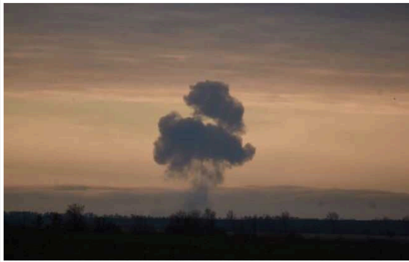
Окупанти знову вдарили по Харкову КАБами

Росія нанесла удари КАБами по центральній частині Харкова, приліт стався біля медичного закладу, – повідомив мер міста.