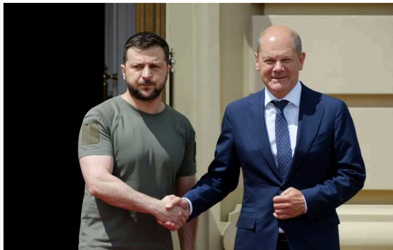
Шольц і Зеленський зустрінуться в Нью-Йорку, - ЗМІ

Канцлер Німеччини Олаф Шольц зустрінеться з президентом України Володимиром Зеленським у Нью-Йорку.