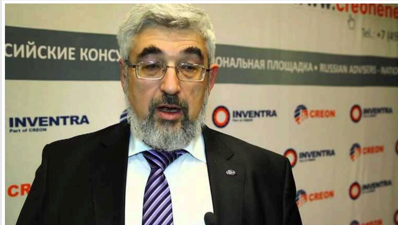
ВАКС конфіскував активи російського олігарха Горіловського та двох його бізнес-партнерів

ВАКС задовольнив позов Міністерства юстиції щодо стягнення в дохід держави українських активів російського виробника полімерних труб.