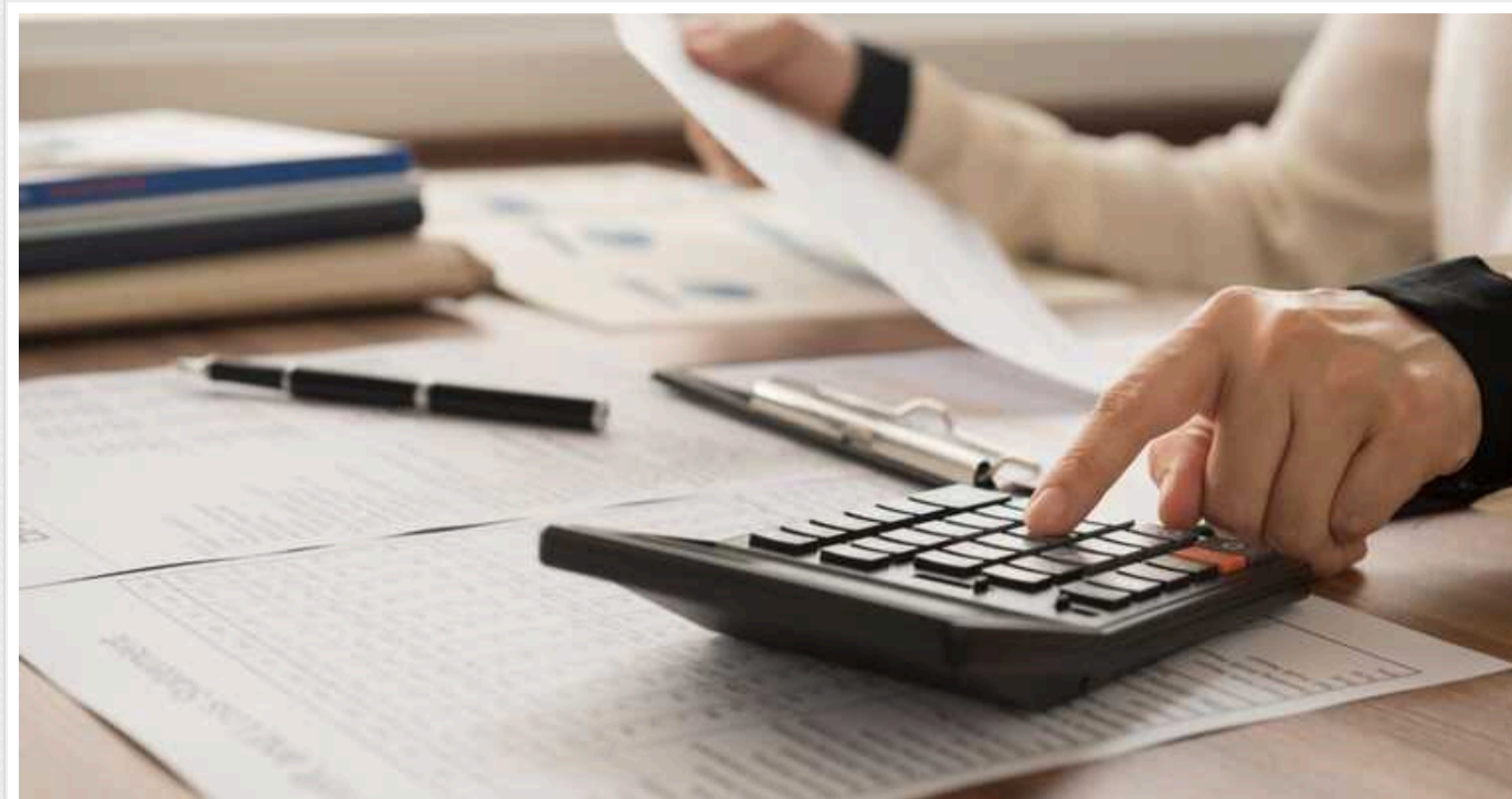
У Києві викрили бухгалтера компанії, який ухилився від сплати 4,8 мільйона гривень податків

Детективи ТУ БЕБ у місті Києві викрили бухгалтера компанії, який ухилився від сплати 2,5 млн грн податку на додану вартість і 2,3 млн податку на прибуток.