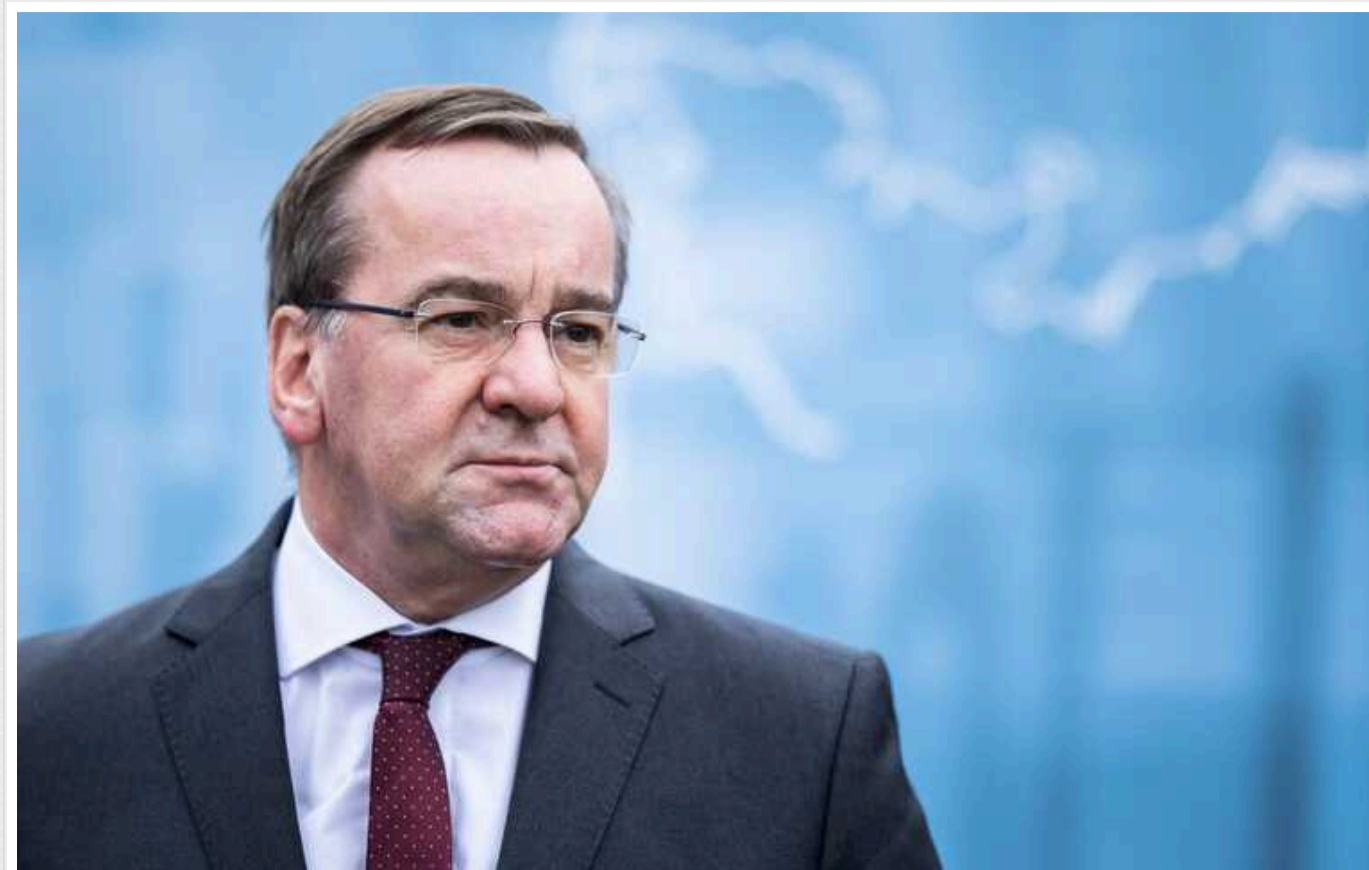
"Поразка України коштуватиме німцям набагато дорожче, ніж нинішня підтримка", - Пісторіус

"Поразка України коштуватиме німцям значно дорожче, ніж теперішня підтримка": потужний виступ міністра оборони Німеччини Бориса Пісторіуса.