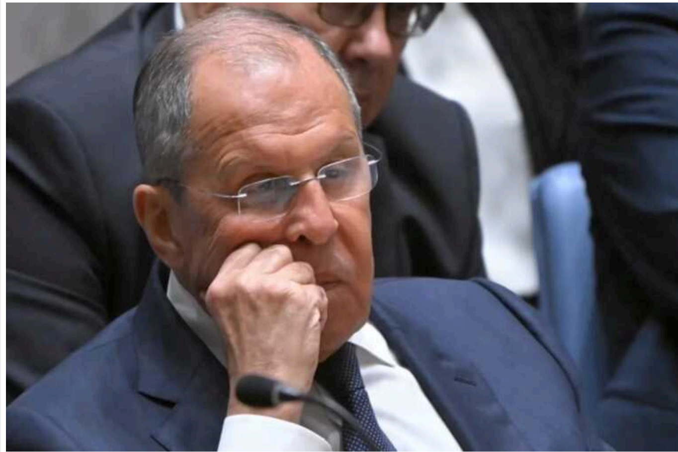
Росія заявила про готовність до війни з НАТО в Арктиці, - Politico

Міністр закордонних справ Росії Сергій Лавров заявив, що РФ «в повній мірі готова» до конфлікту з НАТО в Арктиці. Так впливовий американський новинний сайт Politico інтерпретував заяву російського чиновника, зроблену напередодні.