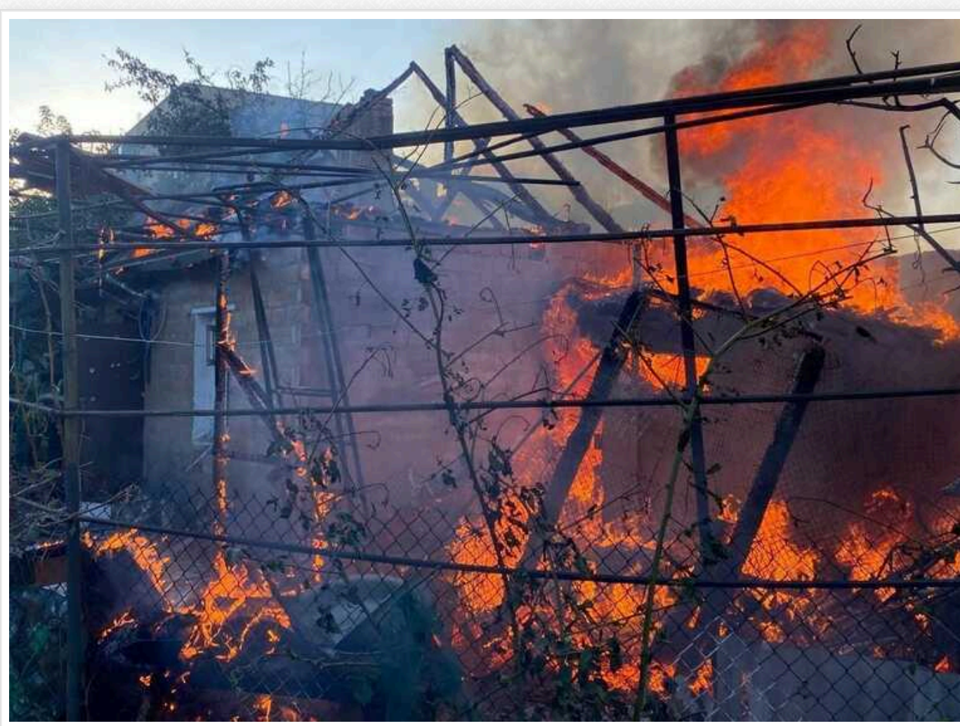
Окупанти обстріляли Нікопольщину з артилерії та дронів: постраждав чоловік

Ворог атакує Нікопольський район. Постраждав 48-річний чоловік.