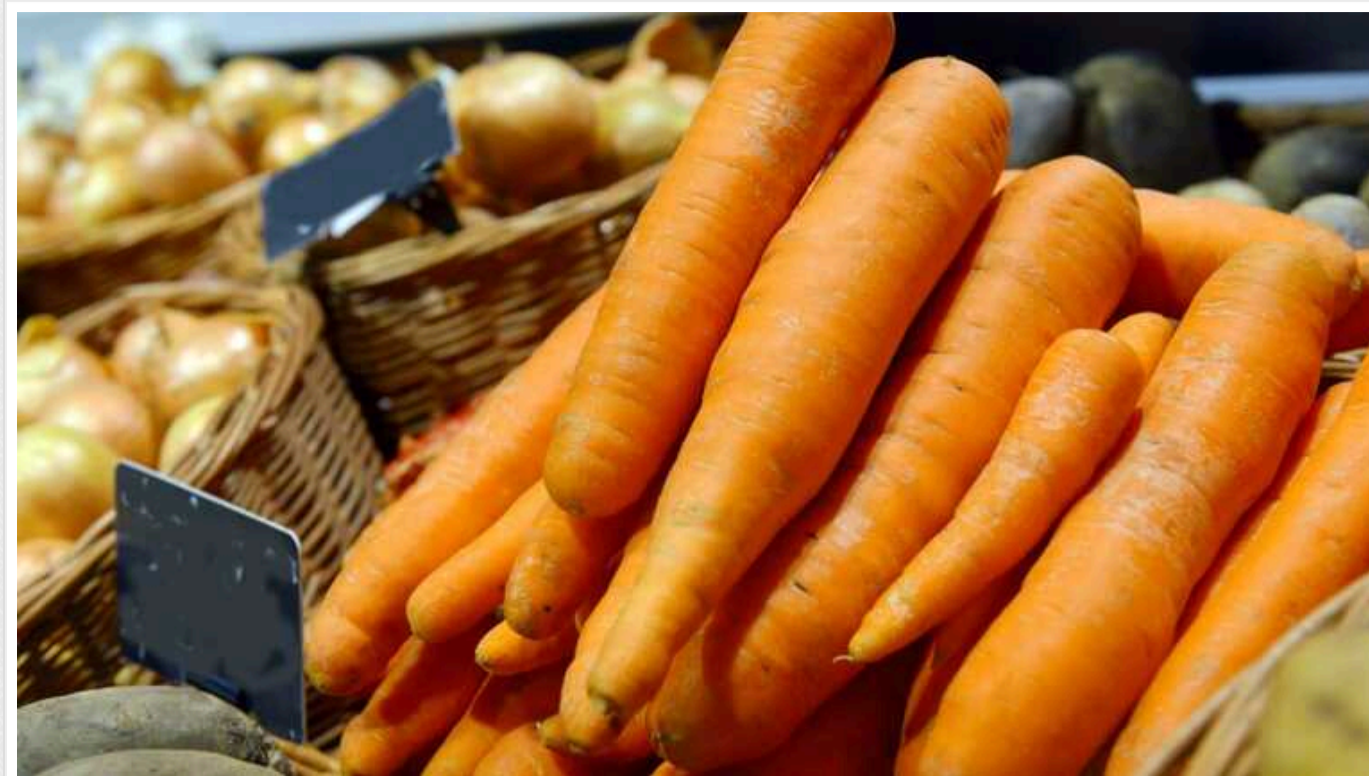
В Україні зростають ціни на моркву: вже вдвічі перевищують торішні

Збільшення торговельної активності сприяє зростанню цін на моркву в Україні, повідомляють аналітики проекту EastFruit .