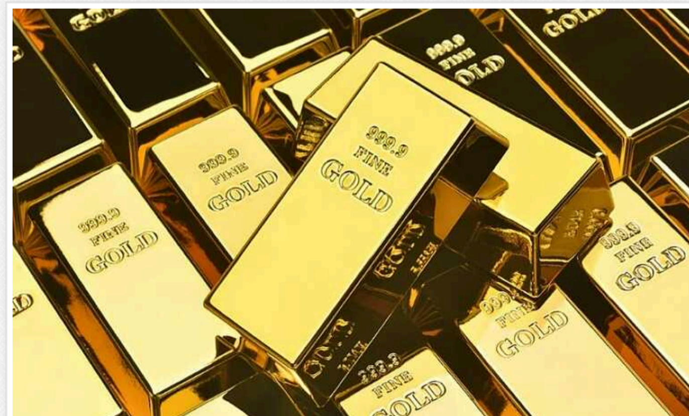
Вартість золота оновила історичний рекорд і піднялася до 2640,4 долара за унцію

Під час сьогоднішніх торгів ціна золота подолати позначку в 2640 доларів за унцію й утримується на цьому рівні.