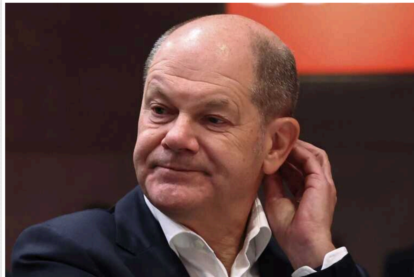
Політичне майбутнє Шольца буде вирішуватися цієї неділі, - Politico

Цієї неділі визначиться політичне майбутнє Шольца, повідомляє Politico.