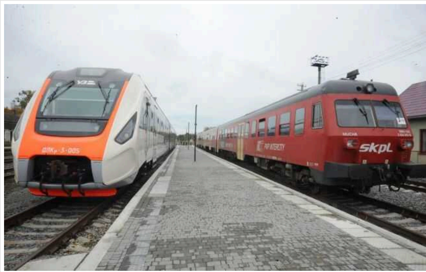
«Укрзалізниця» продовжила продаж квитків на популярний поїзд Варшава – Львів

Продаж квитків на поїзд Варшава – Львів, що курсує через Рава-Руську, відновлюється після короткої перерви. Це один з найпопулярніших рейсів серед українців.