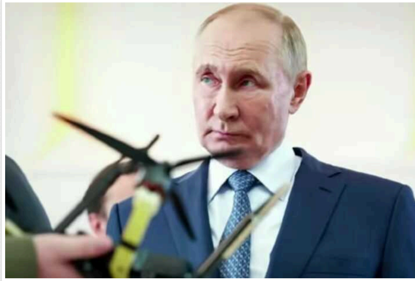
Кремль нарощує випуск БПЛА у спробах показати компенсацію наслідків війни, – ISW

Експерти Інституту вивчення війни вважають, що Кремль збільшує виробництво безпілотників, намагаючись компенсувати соціальні та економічні наслідки війни в Україні.