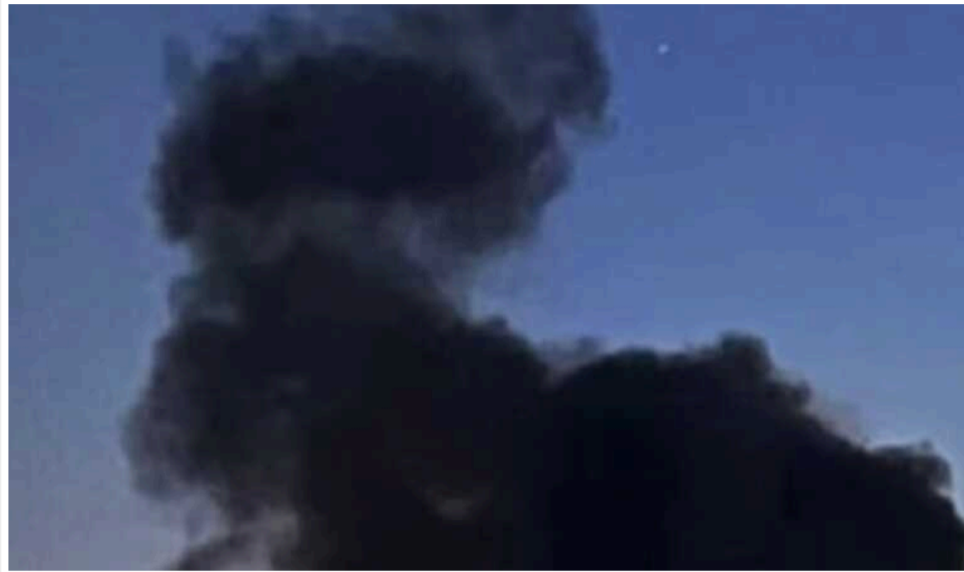
У Рівному та на Хмельниччині вночі лунали вибухи

Вночі 20 вересня у Хмельницькій області під час повітряної тривоги, яка розпочалась о 01:04, було чути звуки вибухів.