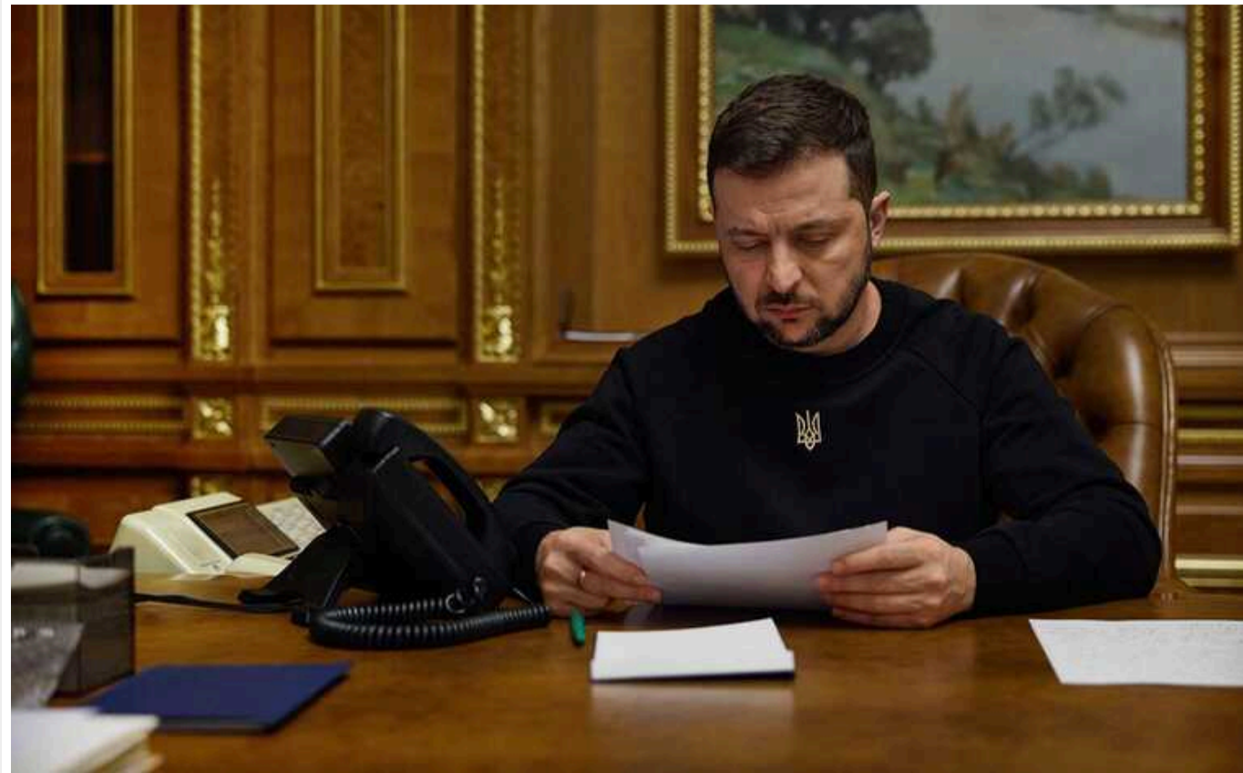
Зеленський ввів санкції проти кількох фізичних і юридичних осіб з РФ, КНР і Ірану

Відповідно до Указу Президента, під обмеження потрапили шестеро громадян строком на десять років.