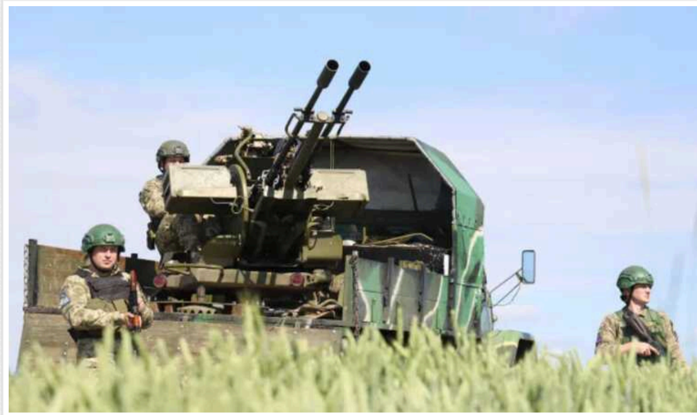
Окупанти на Донеччині захопили кілька кварталів у Гірнику та рухаються на захід від Українська

У місті Гірник окупанти намагаються просуватися, проте бійці ЗСУ тримають оборону. В Генштабі повідомляють, що бої тривають.