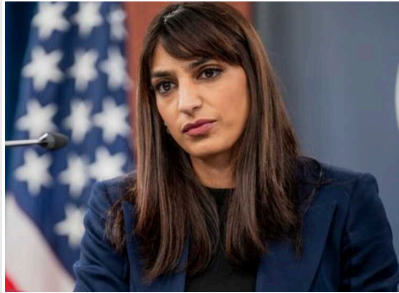
США не вірять, що зняття заборони на удари в глибок РФ допоможуть Україні

Про це заявила Сабріна Сінгх під час брифінгу в Пентагоні.