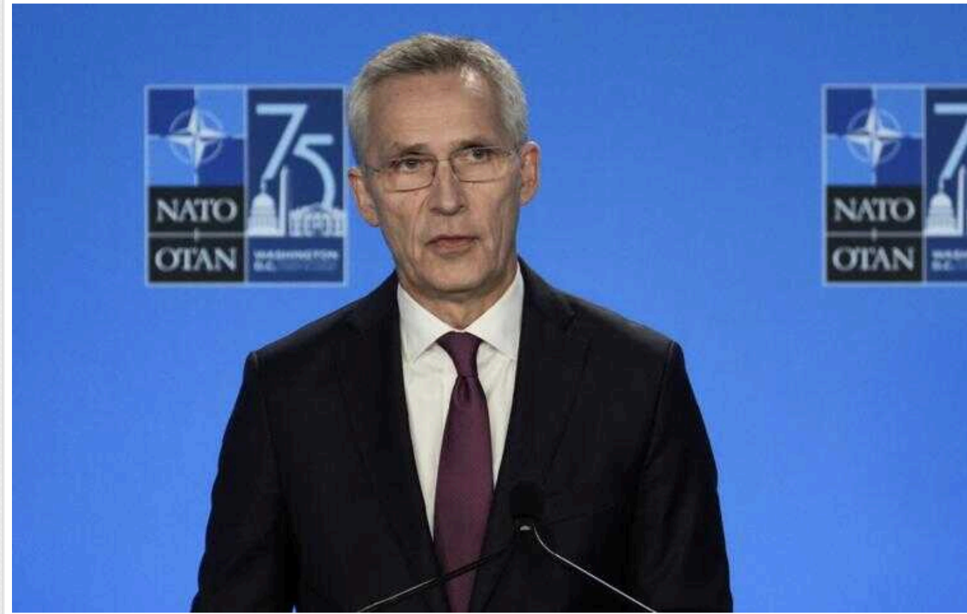
Країнам НАТО вже недостатньо витратити на оборону 2% від ВВП, - Столтенберг

З такими словами виступив генсек Столтенберг.