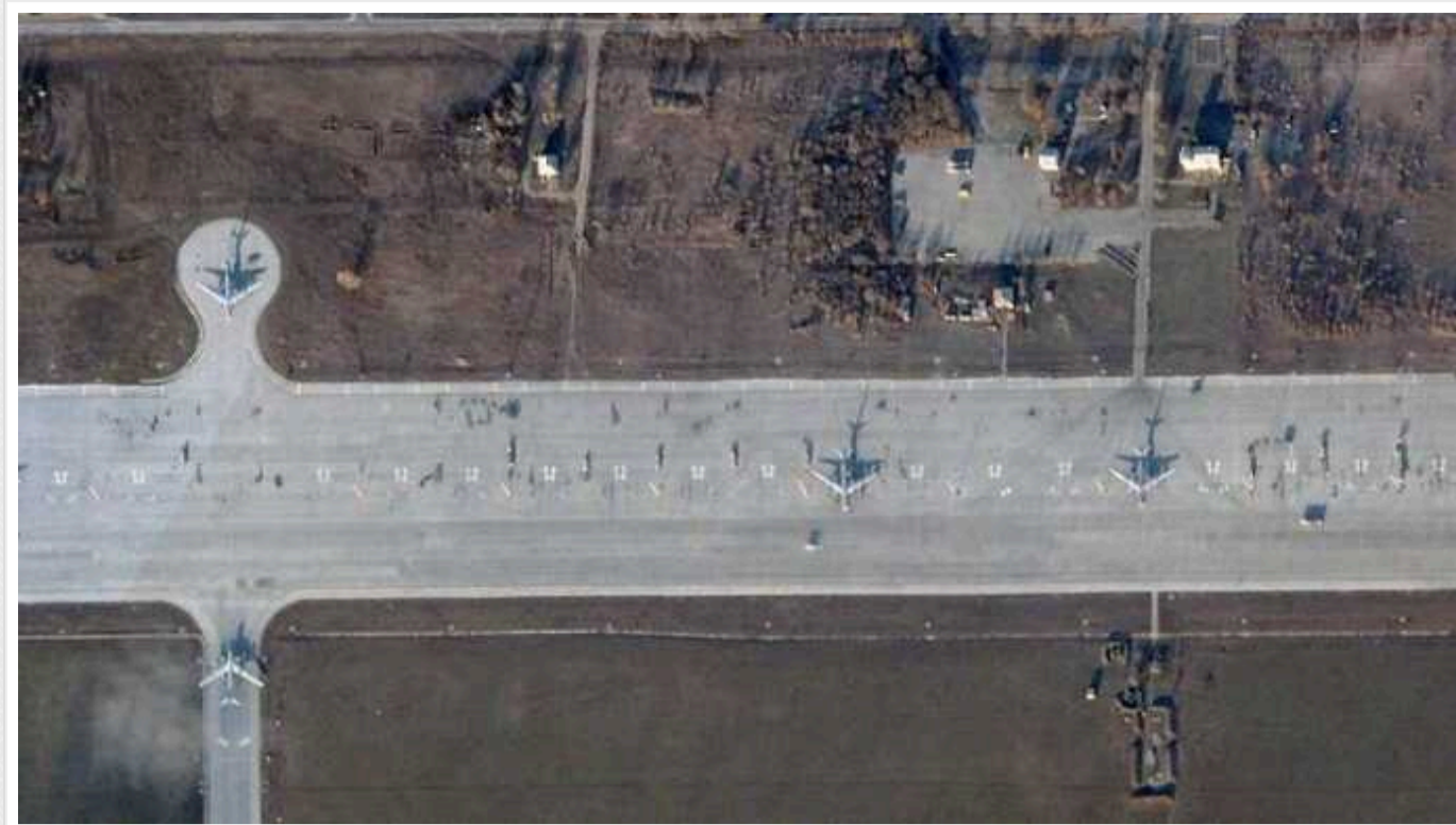
РФ, ймовірно, готується до масованої ракетної атаки: 15 днів триває накопичення X-101, – Tracking

17 вересня на «Енгельс-2» знову приземлився транспортний літак Іл-76, що свідчить про накопичення ракет X-101.