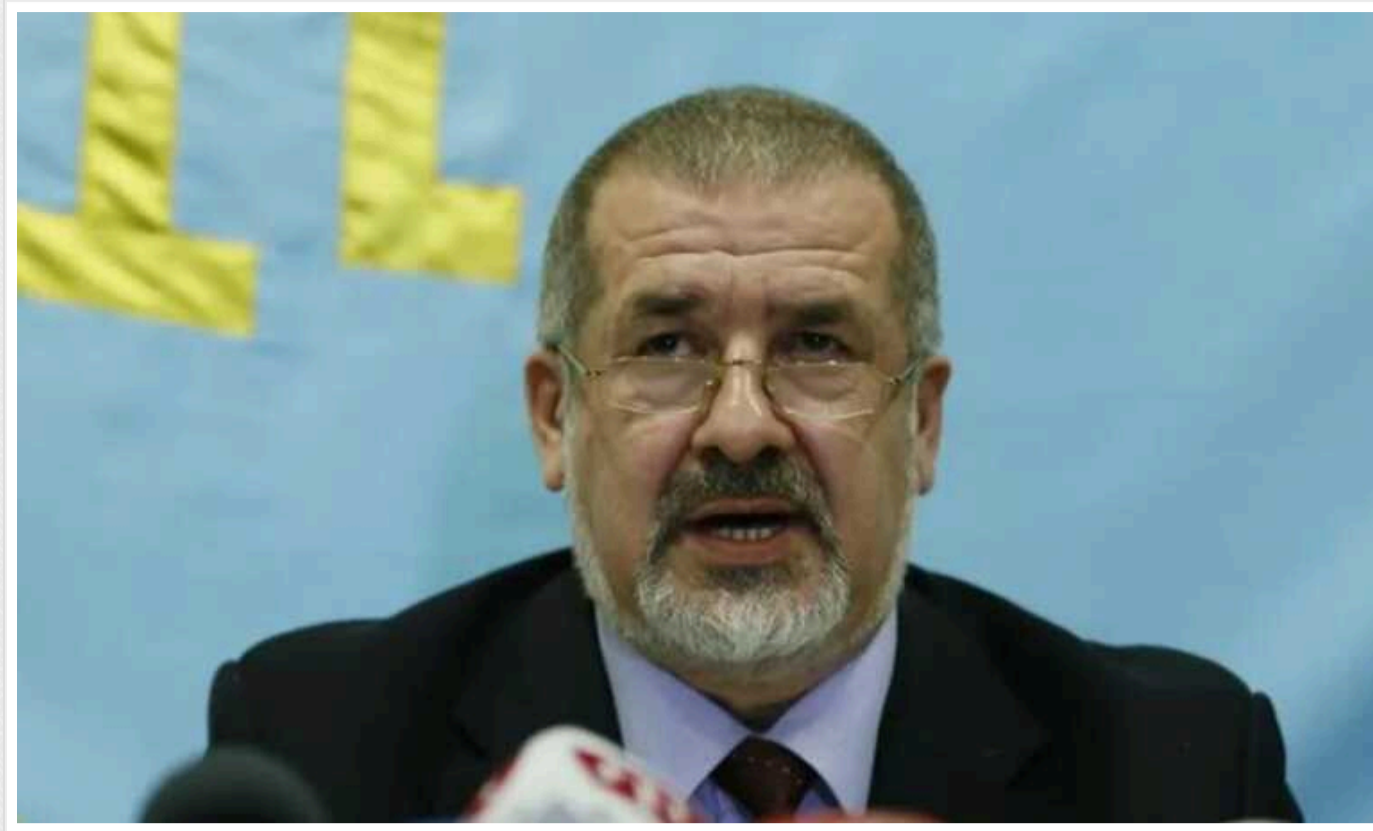
У Меджлісі прокоментували висловлювання Сікорського щодо передачі Криму під мандат ООН

У Меджлісі кримськотатарського народу рішуче відреагували на висловлювання міністра закордонних справ Польщі Радослава Сікорського про передачу Криму під мандат ООН, нібито для підготовки так званого чесного референдуму. У представницькому органі кримських татар такі заяви назвали "неприпустимими та цинічними".