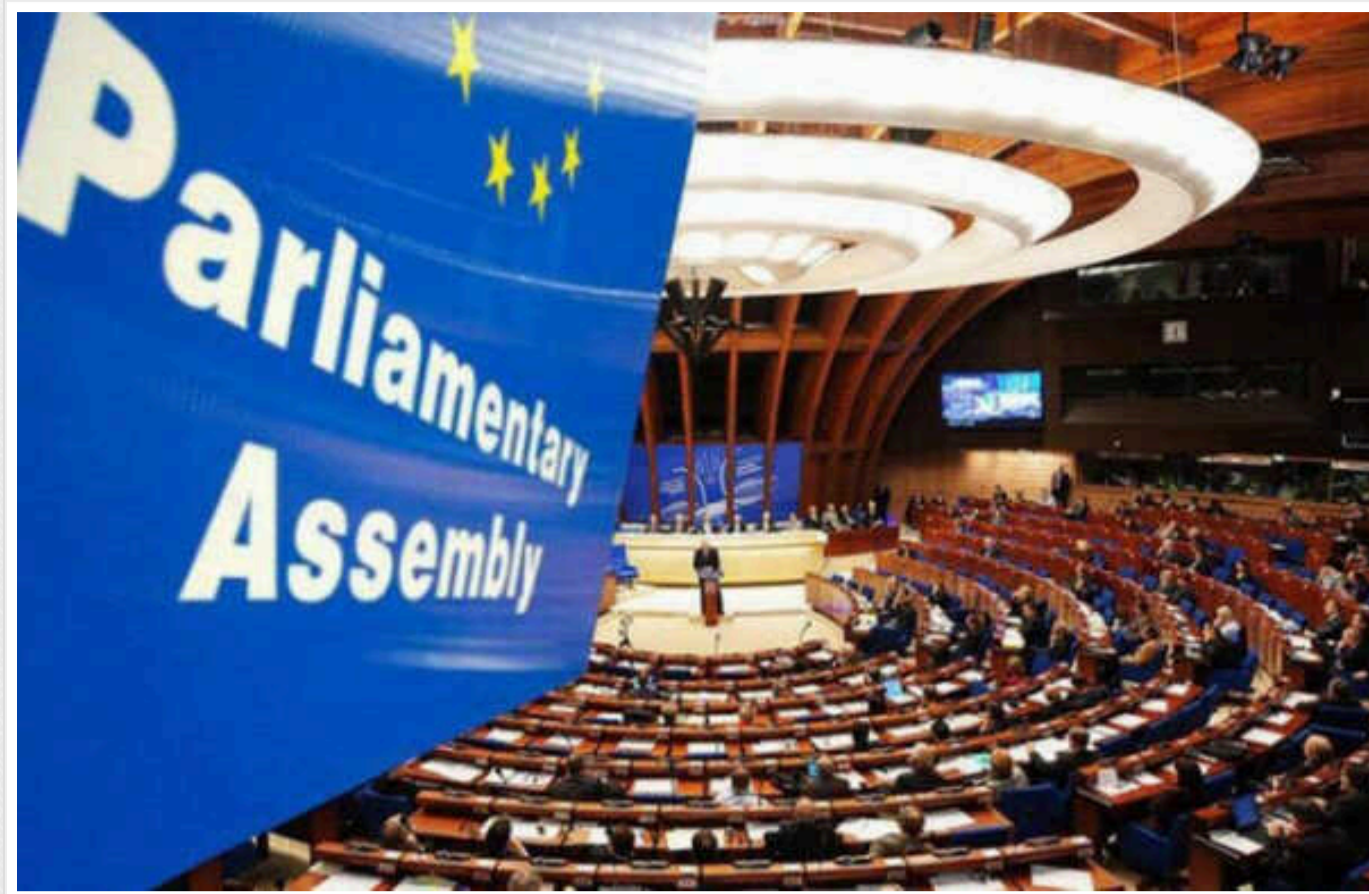
У ПАРЄ висловили занепокоєння щодо впливу Росії на майбутні вибори в Молдові

Делегація Парламентської асамблеї Ради Європи під час завершення дводенного візиту до Молдови 18 вересня підкреслила загрозу, яку дезінформація та підкуп з боку Кремля представляють для майбутніх президентських виборів.