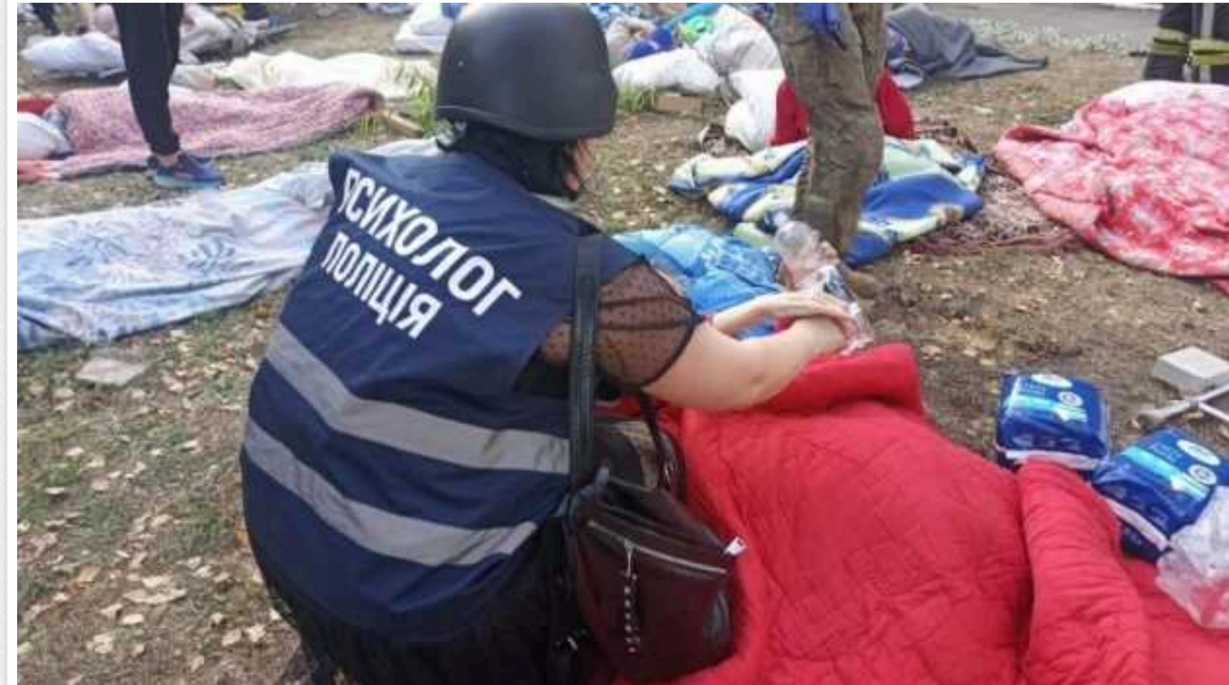
Удар РФ по пансіонату в Сумах: кількість постраждалих зросла до 13, є загиблі

Внаслідок авіаудару по геріатричному пансіонату в Сумській області, де проживають люди похилого віку, постраждало 13 осіб і одна загинула.